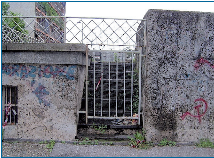
La struttura chiusa dai cancelli, vicino via Palmanova