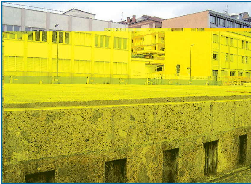
Il "terrazzo" che si affaccia su via Padova, nell'area di cantiere